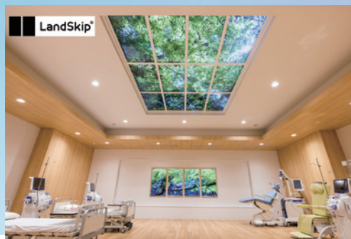
医療機関向けデジタル窓「Medical Window」