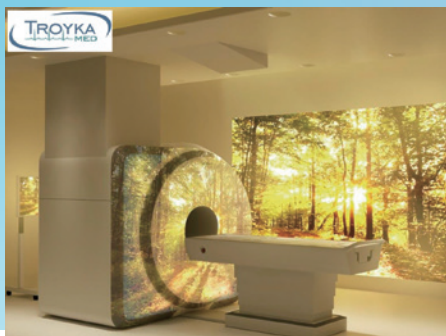
MRI用音響映像アンビアンシステム